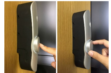
ボタンプッシュ 手回し

2) コントローラーのボタンをプッシュすることで、開錠・施錠ができます。また、コントローラーを手回しても、開錠・施錠可能です。